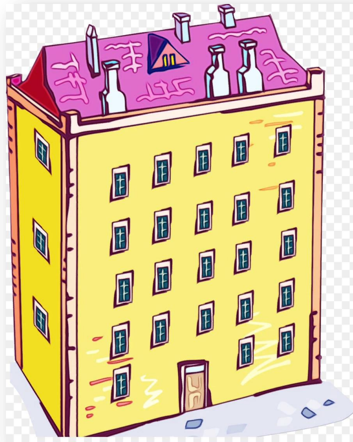
Многоэтажный дом (дом, в котором этажей больше, чем один)