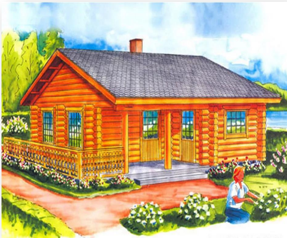
Одноэтажный дом (дом с одним жилым этажом)

Дом – это сооружение, созданное человеком для удобной жизни. Дома бывают разные, но любой из них имеет стены, пол, крышу, окна и двери.