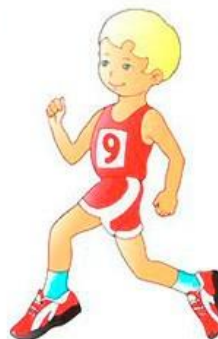
легкая атлетика, бег