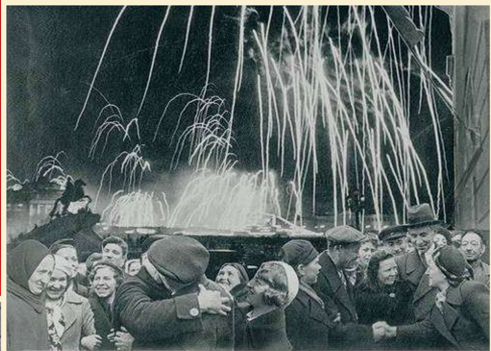
«Великая победа одержана советскими войсками под Ленинградом»

Победе радовалась вся страна, но эта радость была со слезами на глазах, так как в каждой семье, в каждом доме кто-то погиб на этой страшной войне.