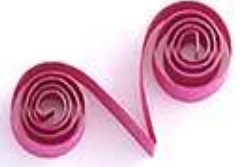
завиток в форме V