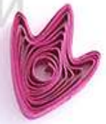
утиная лапка (птичья лапка)