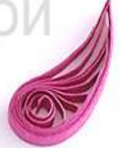
изогнутая капля (крыло, лепесток)