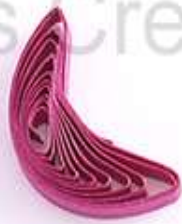
изогнутый полукруг (месяц, полумесяц)