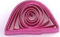
полукруг (конфетка, круглый леденец, половинка луны)