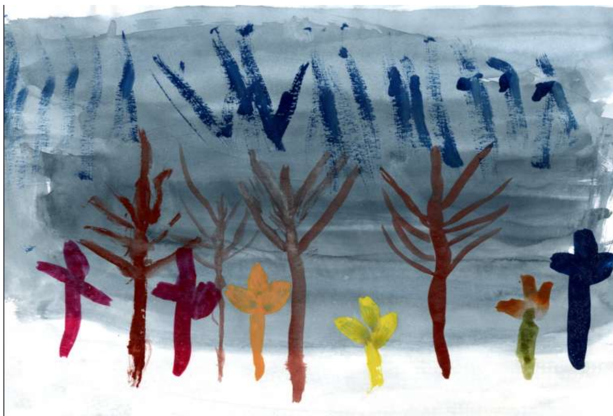
рис. 1 «Пасмурный весенний день» Данила Л.