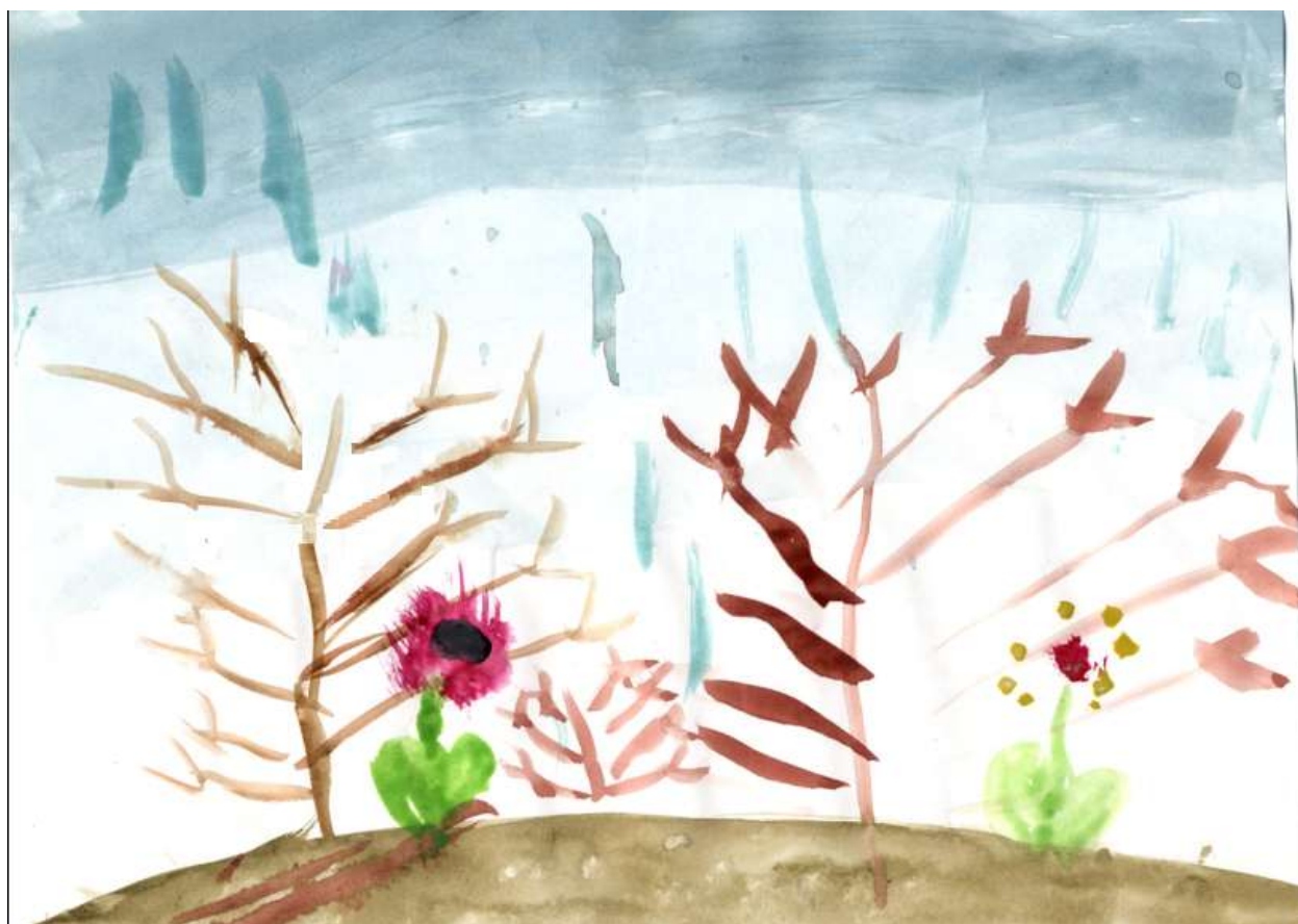
рис. 2 «Пасмурный весенний день» Лиза К.