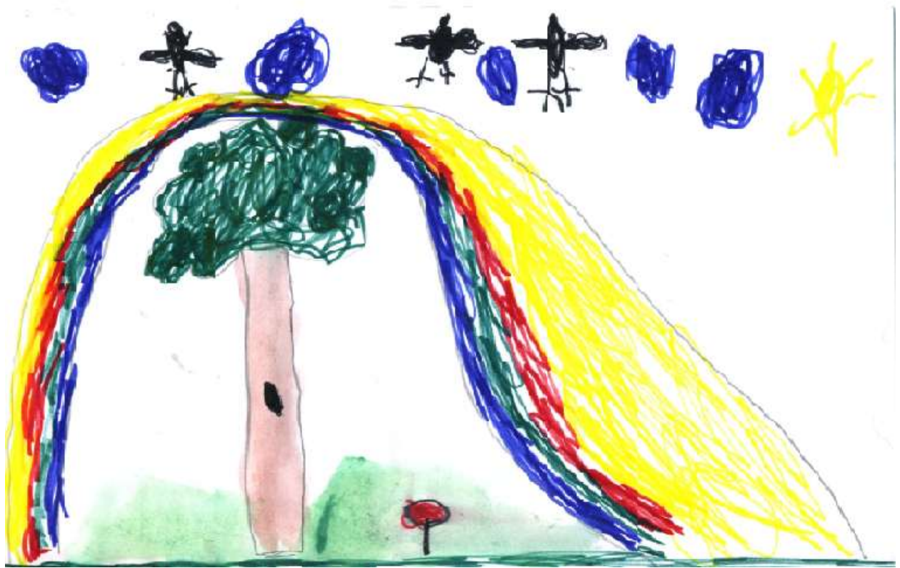
рис. 3 «Сказка о птицах» Денис К.