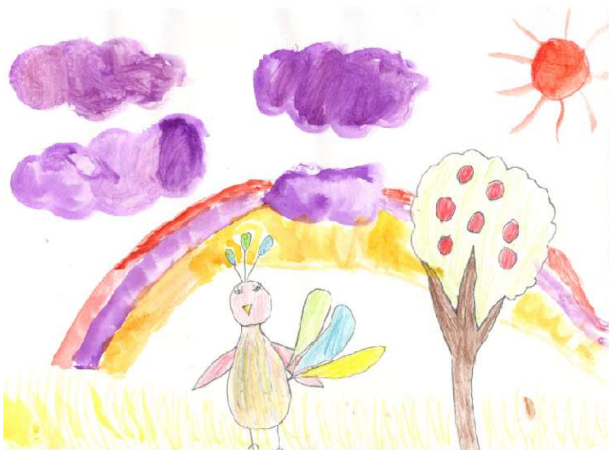
рис. 2 «Сказка о птицах» Россина П.