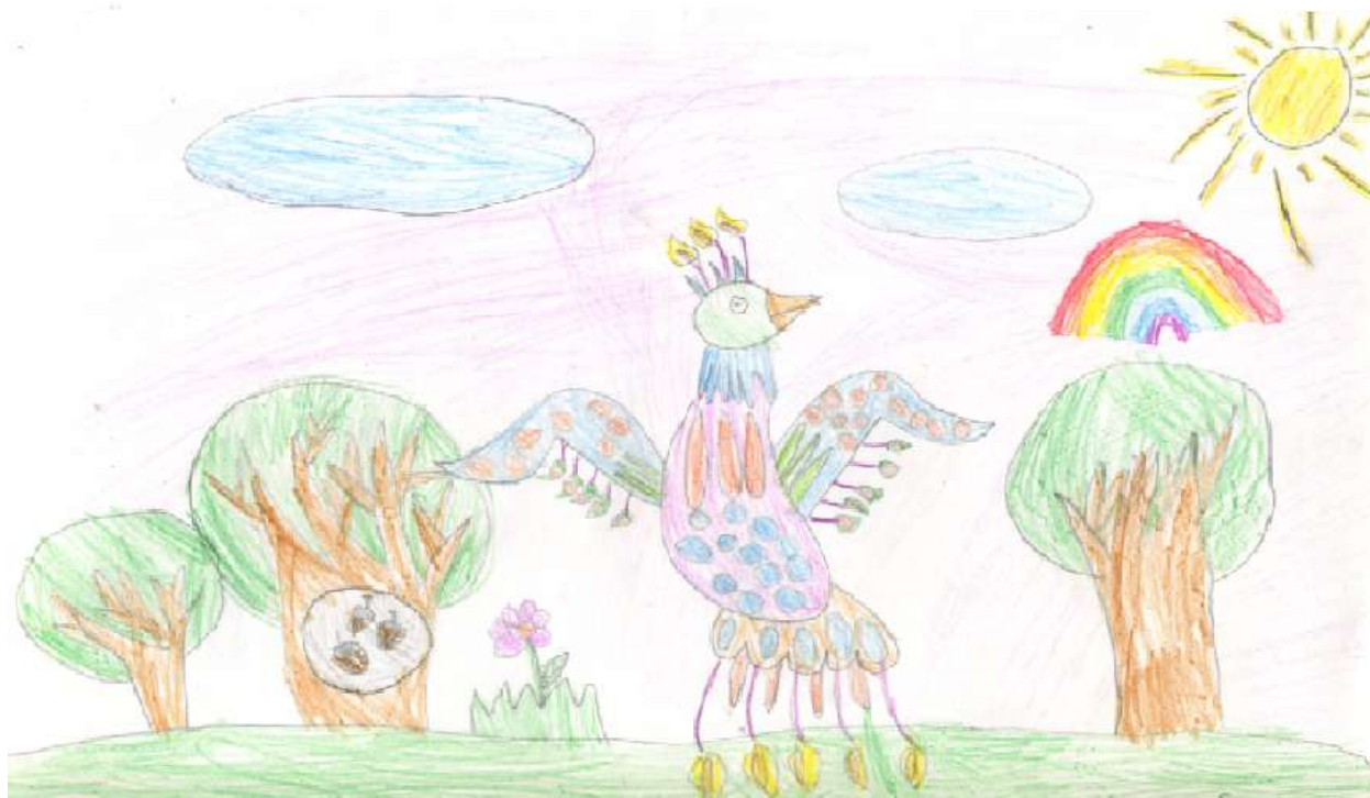
рис. 1 «Сказка о птицах» Салбиназ И.