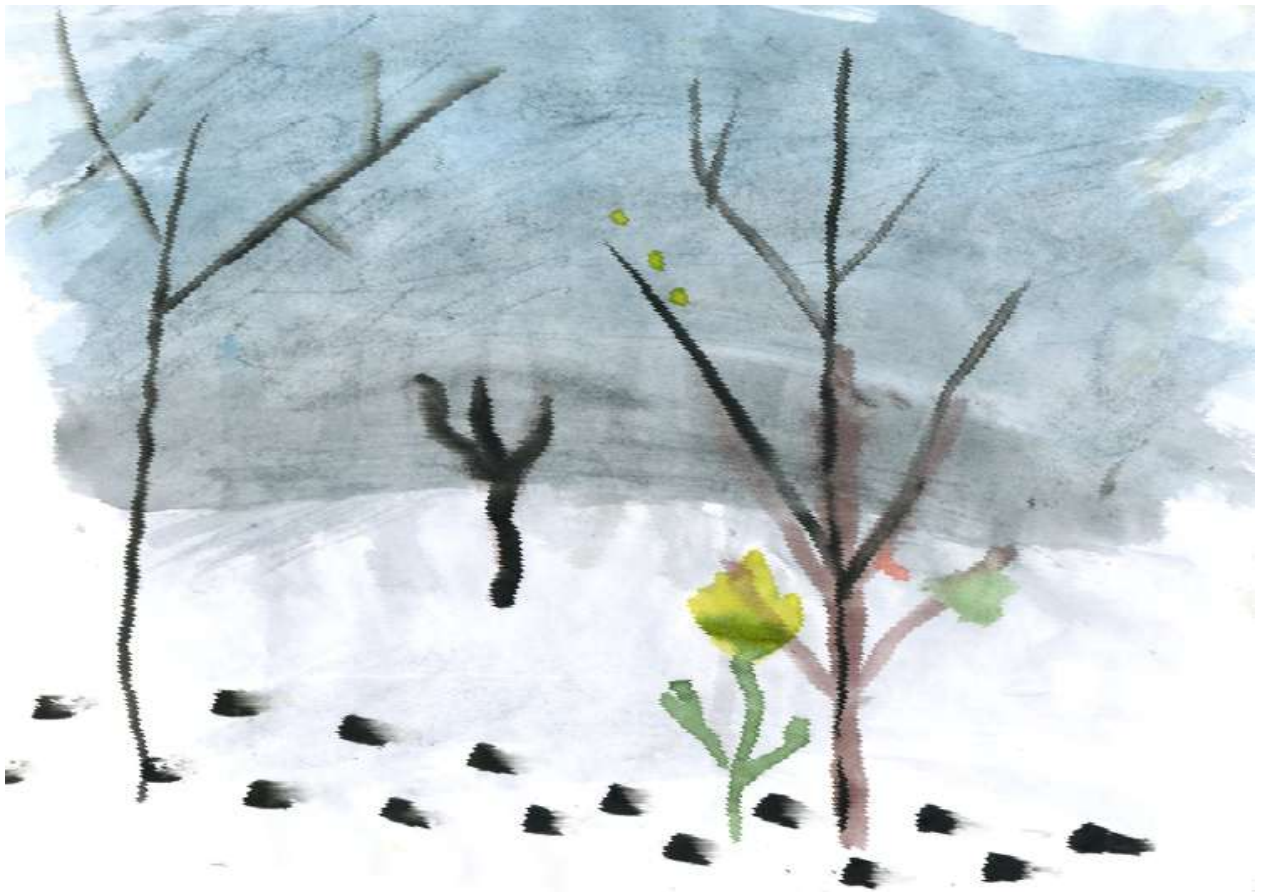
рис. 3 «Пасмурный весенний день» Дима В.